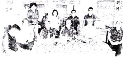
▲砂交通部长李景胜(前排右三)希望美里河能成为大马最干净的河流之一。

他表示，砂河流局未来会 继续在其他甘榜举办更多类似 活动，让人民知道保护河流清 洁与卫生的重要性，并与其他 单位持续保持密切合作，共同 维护河流的清洁与卫生。